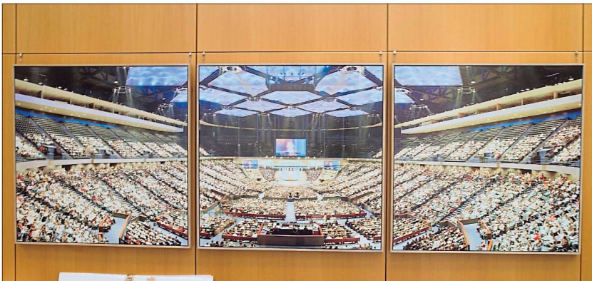
Mit Peter Gransers Fotografien wurden die Kunsttage gestern in der Kreissparkasse eröffnet.