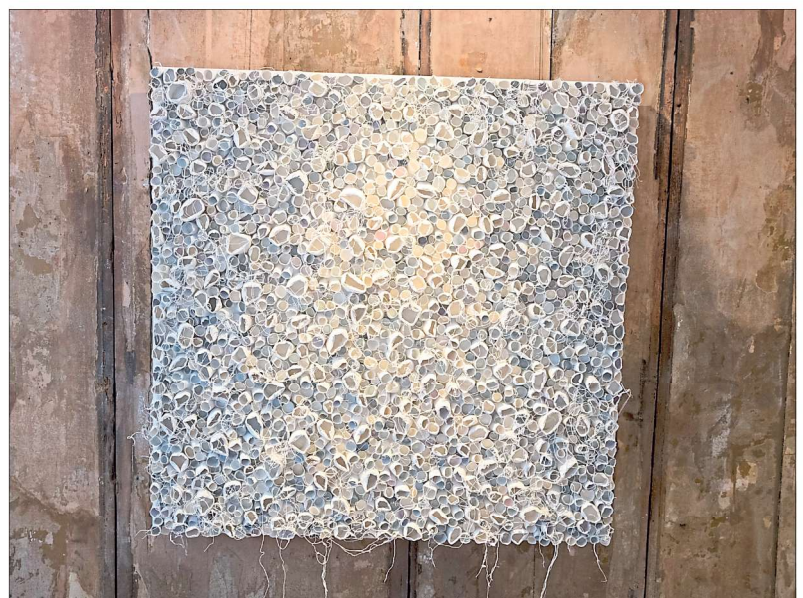
Im Haus Vier in der Nürtinger Altstadt präsentiert Gisela Reich Textile Wand- und Raumobjekte.